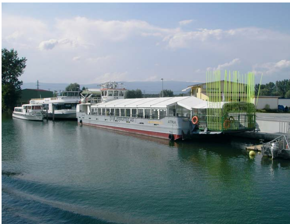
Le chaland « Attila » devant le chantier TSM Perrottet à Sugiez.