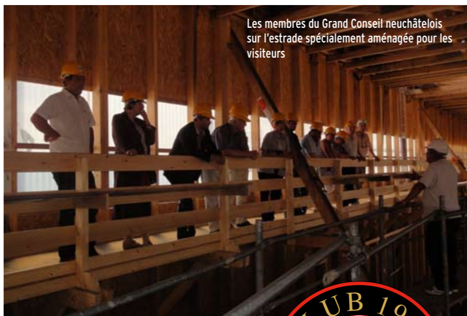
Les membres du Grand Conseil neuchâtelois sur l'estrade spécialement aménagée pour les visiteurs

Le bateau à vapeur «Sirius» sera aussi de la partie et proposera un trajet découverte sur la Broye.