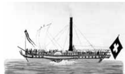
Union , das erste Dampfschiff auf den Juraseen (1826)

ger- und dem Bielersee. Ausgestattet mit einem Holzrumpf, sicherte der Dampfer Union mehr schlecht als recht die Verbindung Yverdon-Nidau, wobei er durch allzu häufige Versandung in der noch nicht kanalisierten Zihl behindert wurde. Dieser Dienst dauerte nur zwei Jahre, und erst der tatkräftige Philippe Suchard und sein Dampfschiff Industriel von 1834 mit Eisenrumpf sorgten dafür, dass der Dienst zuverlässig, erfolgreich und dauerhaft wurde.