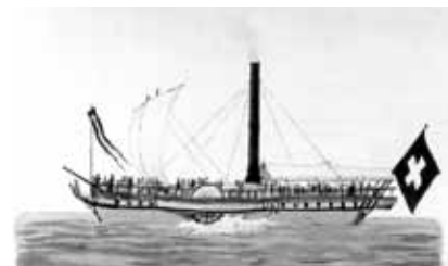
Union , premier bateau à vapeur des lacs jurassiens (1826).

et de Bienne. Doté d'une coque en bois, le vapeur Union assurait tant bien que mal la liaison Yverdon-Nidau, étant perturbé par de trop fréquents ensablements dans la Thielle pas encore canalisée. Ce service n'aura duré que deux ans et il faudra attendre l'énergique Philippe Suchard et son vapeur Industriel de 1834 à coque de fer pour que le service devienne fiable, prospère et définitif.